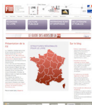
Page d'accueil du site Internet de la FILL http://www.fill.fr/fr/accueil