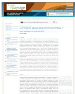
Page d'accueil de la revue électronique Projets de paysage http://www.projetsdepaysage.fr/fr/accueil