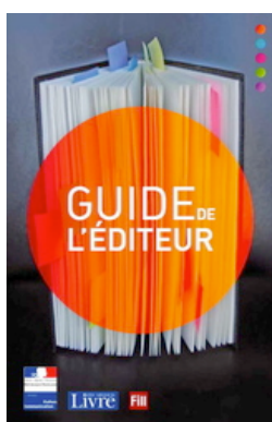
Guide de l'Éditeur Coédition FILL et CNL