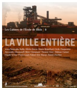
Les Cahiers de l'École de Blois n°8 : La Ville entière Dirigée par Jean-Christophe Bailly